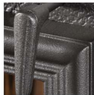
Détail fonte [Cast iron details]