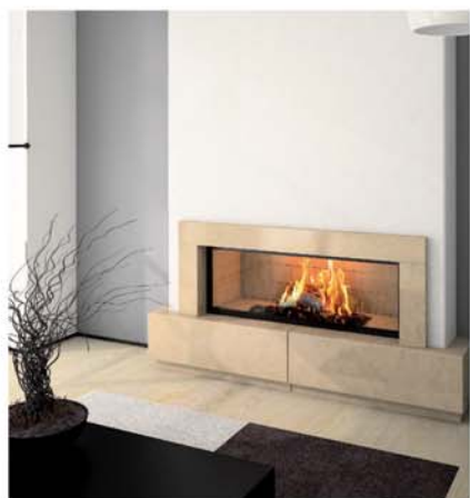
○ — Cassandre