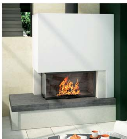
○ — Melody