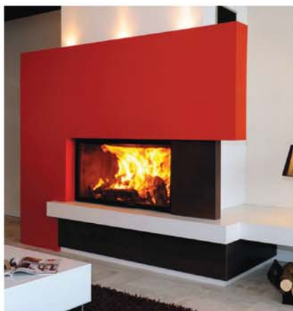
○ — Kensho